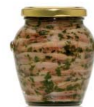
gr 310 OR