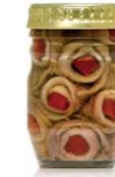
gr 80 MD