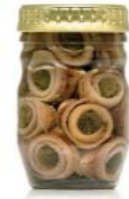
gr 80 MD