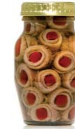
gr 160 MD