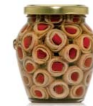
gr 310 OR