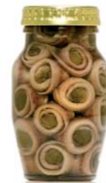
gr 160 MD