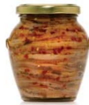
gr 310 OR