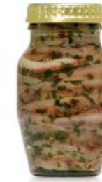
gr 160 MD