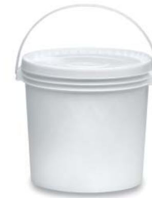
18 LT/ 19,2 Kg