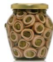
gr 310 OR