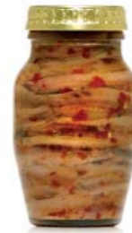
gr 160 MD