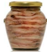
gr 310 OR